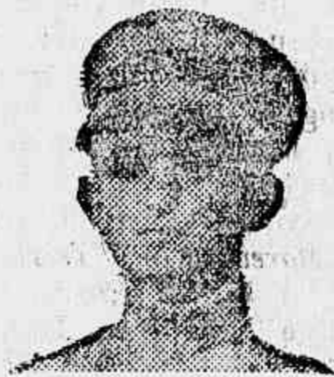
Srs. Viúva Silveira & Filho

Clovis Medeiros do Amaral, guarda civil n.º 26, residente em Fortaleza, Ceará, declara que soffreu durante 13 mezes de horrosas manifestações syphiliticas de todo o caracter: Syphilis terciaria com localisação no larynge e pharynge (começo de cancro muito adiantado) tendo já destruido a parte da glotte, idem da região frontal interna e complicação cerebral, um bubão em chaga com 15 centímetros de extensão por 4 de profundidade, rumatismo agudo em todo o corpo, além de outras manifestações, perdendo por completo o appetite; recorreu a muitos medicamentos aconselhados para tal fim sem o menor resultado; vendo-se perdido retirou-se para Pacatuba, interior do Estado, quando a conselho do provavto magistrado Dr. José Augusto Feliciano de Athayde, juiz de direito da comarca de Pacatuba, que já havia obtido uma cura em sua Exmã. Esposa, começou a usar o milagre depurativo do sangue "ELIXIR DE NOGUEIRA", do Pharmaco. Chimico João da Silva Silveira, sentindo ao 1.º vidro grande appetite e aos 11 vidros estava, com a admiração e espanto de todos, completamente curado.