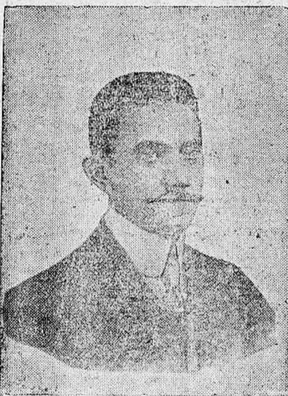
Senador João Thomé de Saboya e Silva ex-presidente do Estado, que dá o nome Avenida á inaugurar-se

do Hymno Nacional. Finda esta cerimonia, a banda de musica se-