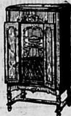
NOVA ELECTROLA VICTOR COM RADIO RE-57

VICTOR DIVISION, RCA VICTOR COMPANY, INC., CAMDEN, NEW JERSEY, U. S. A.