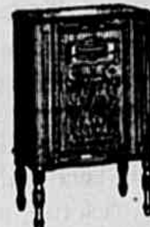
RADIO VICTOR R-35

O novo invento sensacional da Victor para o anno de 1931. Quatro valvulas blindadas. Altofalante conico frizado. Magnifica reproducção. Bellissimo model de madeira. Preço . . .