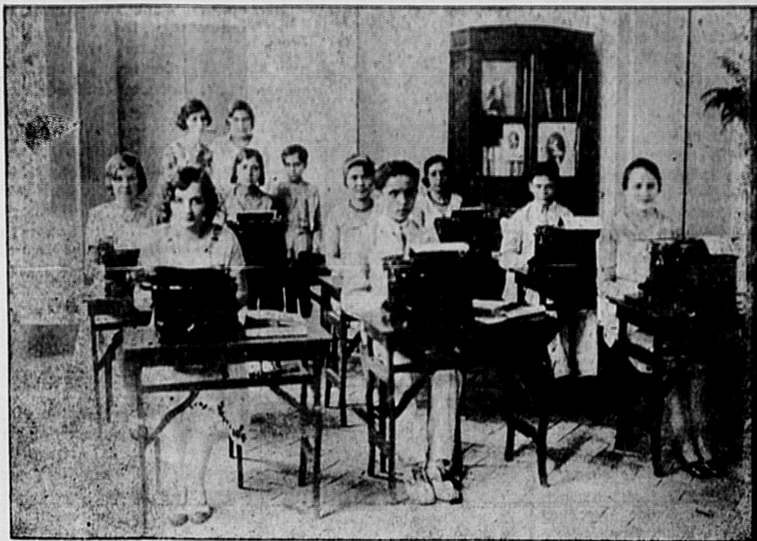
Um aspecto da Escola Remington em actividade

Uma homenagem á "Patria Nova", na pessoa do seu director