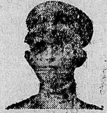
Sr. Vívua Silveira & Filho

Clovis Medeiros do Amaral, guarda n.º 16, residente em Fortaleza, Ceará, declara que soffreu durante 13 meses de horribissimas manifestações syphiliticas do tipo e caracter: Syphilis terciaria com localisação no larynge e pharynge (comoção de cancro muito adiantado) tendo já destruido a parte da glotta, idem da região frontal interna e complicação cerebral, um búbulo em chaga com 15 centímetros de extensão por 4 de profundidade, rheumatismo agudo em todo o corpo, além de outras manifestações, perdendo por completo o appetite; recorreu a muitos medicamentos aconselhados para tal fim sem o menor resultado; vende-se perdido retirou-se para Pacatuba, Interior do Estado, quando a conselho de prevezo materno Dr. José Augusto Feliciano de Albuquerque, juiz de direito da comarca de Pacatuba, que já havia obtido uma cura em sua Esposa. Esposa, começou a usar o milagroso depurativo de sangue «ELIXIR DE NOGUEIRA» de Pharmacia Chimico João da Silva Silveira, senão que 1.º vidro grande appetite e em 11 vidros espago, com a admiração e espanto de todos, completamente curado.