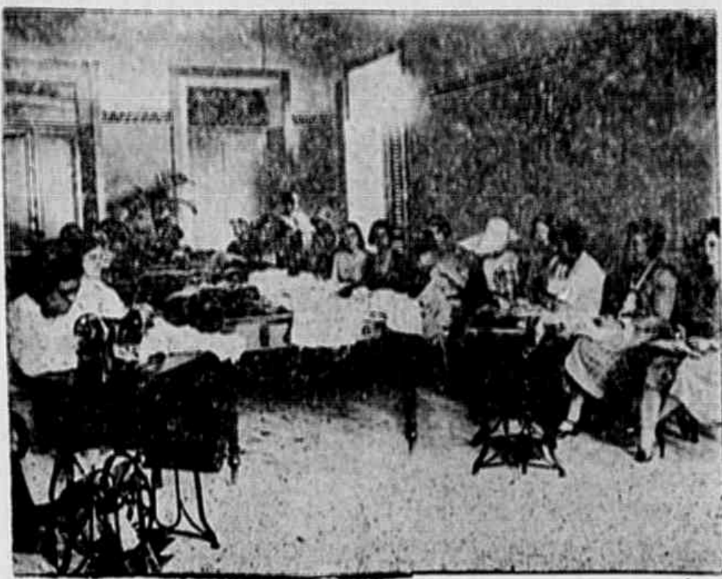
A alta sociedade cearense costurando para os pobres.

O leitor não conhece os graphicos, publicados no coração, com que se acha syntheticamente representada a organização geral das obras cidadinas de benemerencia. Poderia, por elles, ter feito uma idéa acerca das proporções e do valor da importante obra de philantropia que essas organizações vêm realizando, com um espirito de continuidade, de harmonia, de dedicação e de modestia que realmente dignifica e eleva as tradições de nossa cultura moral. Assim, se persuadiria de que, si ha no meio em que vivemos muita tristeza e muito clamor, que é preciso remediar com alma e com solidariedade humana, tambem ha bellos movimentos de bondade activa e persistente que é preciso animar, consolidar, multiplicar, sob todos os aspectos e capacidades da vida onde ha victimas da descuidade de uns e do egoismo de outros. Porque, como dizia, ao tempo em que se cuida afeiar os exemplos que a Piedade sempre cultivou, ainda alguém se recorda de renovar-lhe o encanto fecundo e constellado.