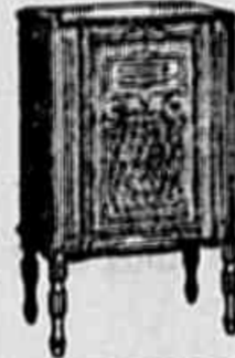
RADIO VICTOR R-35