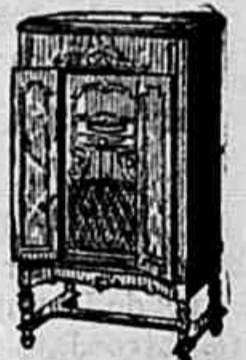
NOVA ELECTROLA VICTOR COM RADIO RE-57

VICTOR DIVISION, RCA VICTOR COMPANY, INC., CAMDEN, NEW JERSEY, E. U. de A.