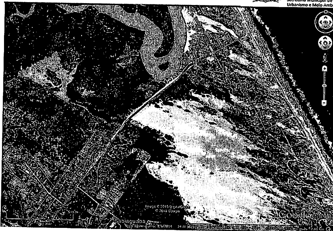
Figura: Imagem GOOGLE EARTH - 2015