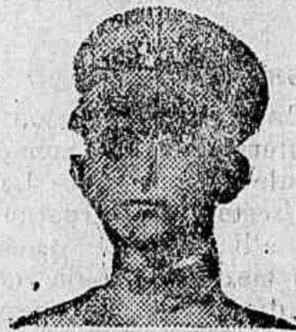
Sra. Viuva Silveira & Filho

Clovis Medeiros de Amaral, guarda vil n.º 26, residente em Fortaleza, Ceara, declara que soffreu durante 13 mezes de horrosas manifestações syphiliticas de todo o caracter: Syphilis terciaria com localisação no larynge e pharynge (comço de cancro muito adantado) tendo já destruido a parte da glotte, idem da região frontal interna e complicação cerebral, um bubão em chaga com 15 centimetros de extensão por 4 de profundidade, reumatismo agudo em todo o corpo, além de outras manifestações, perdendo por completo o appetite; recorreu a muitos medicamentos aconselhados para tal fim sem o menor resultado: vende-se perdido retirou-se para Pacatuba, interior do Estado, quando a conselho do preveço magistrado Dr. José Augusto Feliciano de Athayde, juiz de direito da comarca de Pacatuba, que já havia obtido uma cura em sua Exma. Esposa, conseguiu a usar o milagroso depurativo do sangue: ELIXIR DE NOGUEIRA, do Pharmacia Chimico João da Silva Silveira, sentindo ao 1.º vidro grande appetite e aos 11 vidros estava, com a admiração e espanto de todos, completamente curado.