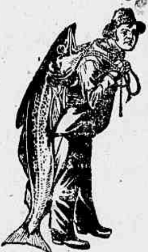
Marca da Emulsão Legitima.

necessitam a Emulsão de Scott que alem de um medicamento é um poderoso alimento concentrado, productivo de sangue, forças e boas côres.