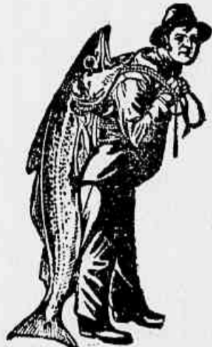
Marca da Emulsão Legítima.

necessitam a Emulsão de Scott que além de um medicamento é um poderoso alimento concentrado, productivo de sangue, forças e boas côres.