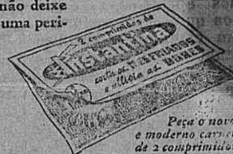
Peça o novo e moderno cartet de 2 comprimidos

Não se descuide! ... Se um simples resfriado o ataca, não deixe que elle se converta em uma perigosa gripe ... Tome Instantina e não se arrependerá. Instantina faz baixar a febre e aniquila os germens infecciosos.