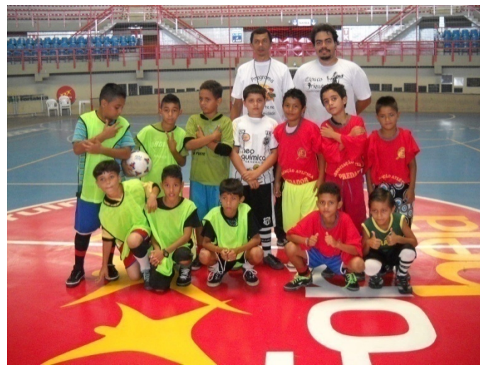
Visita ao núcleo do Ginásio Paulo Sarasate