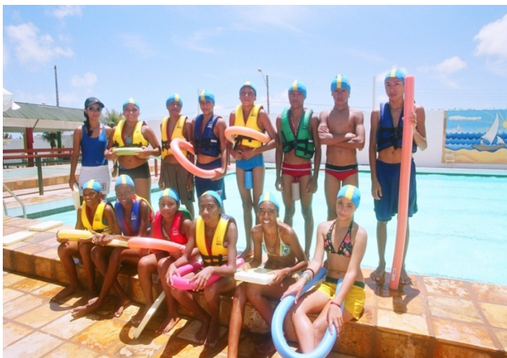
Dia de atividade no núcleo do BnB com entrega de Material aquático.