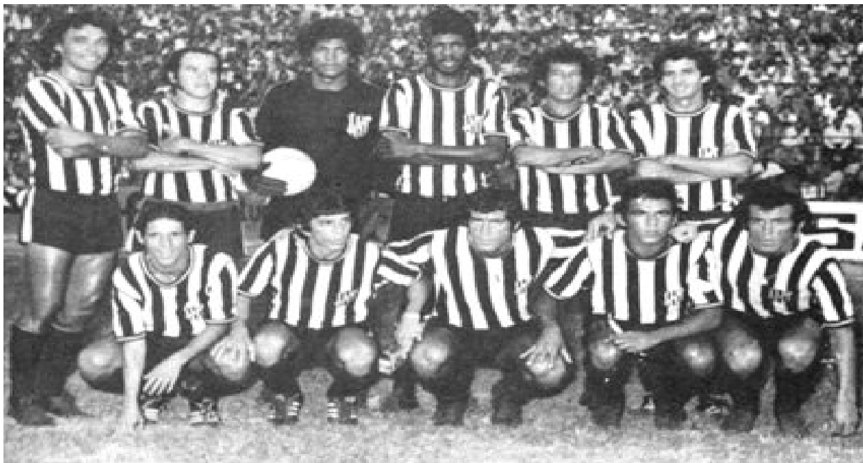
Ceará Sporting Clube - Bi-Campeão em 1972