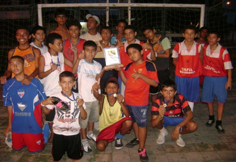
Torneio de Integração entre participantes do núcleo com entrega de troféus e medalhas.