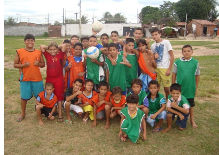
Jogos de Integração entre os núcleos do Jardim Fluminense e Copacabana