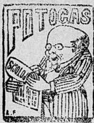
A tribu de ratazanas a renda publica destróe, vão-se embora as palanganas; accioly as unhas rõe.

O rei Eduardo dirigiu um telegramma de felicitações ao capitão Scott, chefe da expedição, que foi promovido. Uma medalha por serviços prestados nas regiões polares será entregue a cada um dos que tomaram parte na interessante exploração.