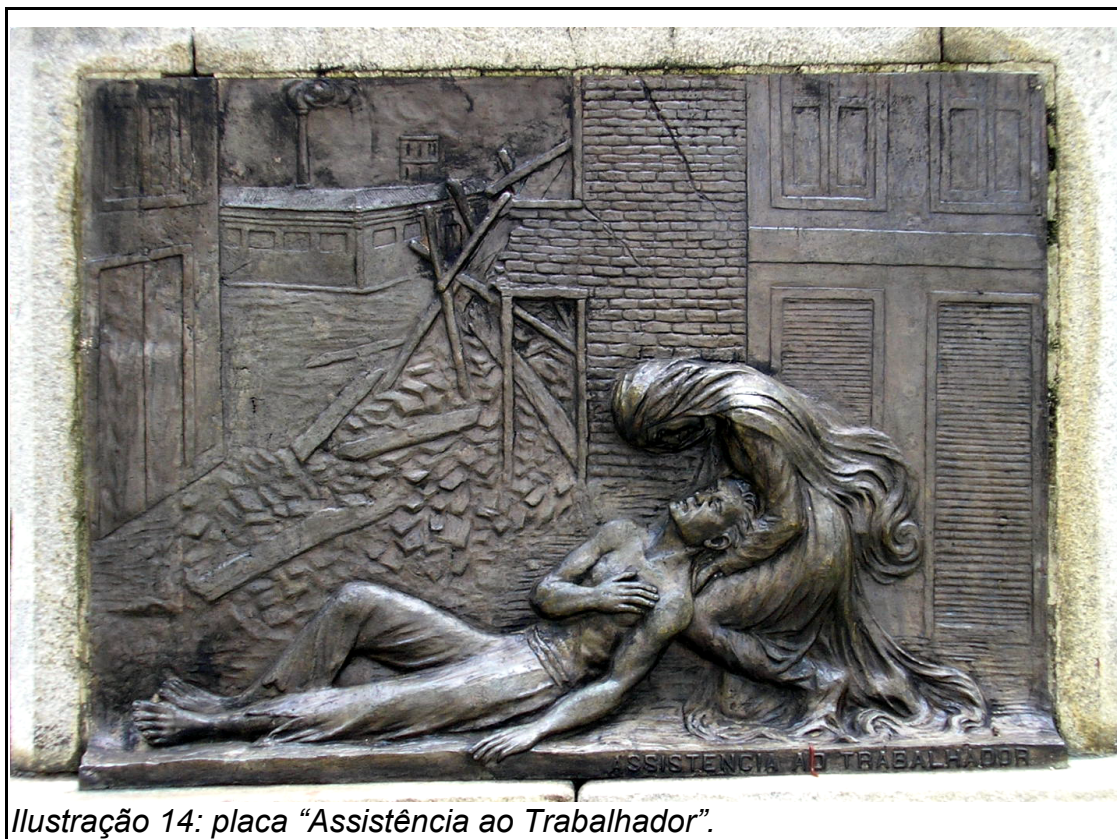
Ilustração 14: placa “Assistência ao Trabalhador”.

Interessante observar a carga idealizada dos trabalhadores, figuras com semblante límpido, no ideal da honestidade do trabalhador do Estado Novo, como um ser singelo que aguarda as ações do governo. Note-se que quase todos apresentam-se descalços, com vestimentas humildes, com exceção da figura que representa o comércio, vestida por completo, como símbolo da civilização e urbanidade, o “progresso” da cidade moderna, que não faz parte do campo, mas que depende dele para o sustentáculo do Estado. E por último, não menos importante, a Oeste, encontra-se a placa “Assistência ao Trabalhador”, que simboliza o programa do Estado Novo no pacto trabalhista.