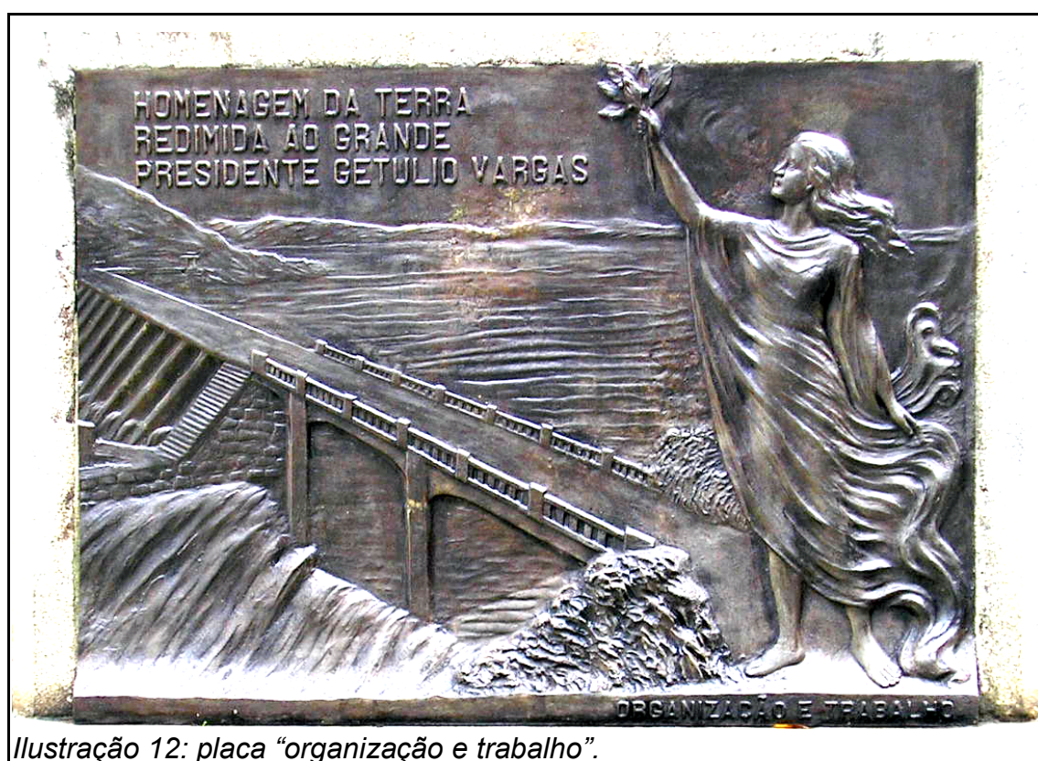
Ilustração 12: placa “organização e trabalho”.

A alegoria feminina da liberdade pode ser vista na placa ao Sul: “organização e trabalho”.