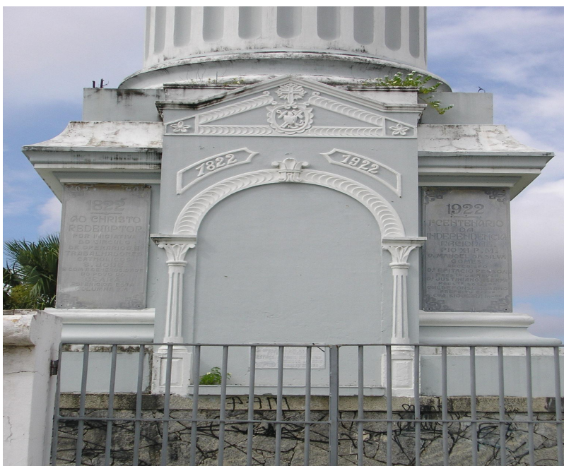
Ilustração 5: Coluna do Cristo Redentor, fotografada por Lindercy Lins.

todas as cousas ". 197 A coluna do Cristo Redentor era tão cara aos circunistas, que, anos mais tarde, em 1958, houve cerimônia de "aposição de uma placa de mármore na coluna do Cristo Redentor com os nomes dos três operários, que dirigiam os trabalhos da construção do monumento no ano de 1922". 198 Como pode-se ver na imagem seguinte.