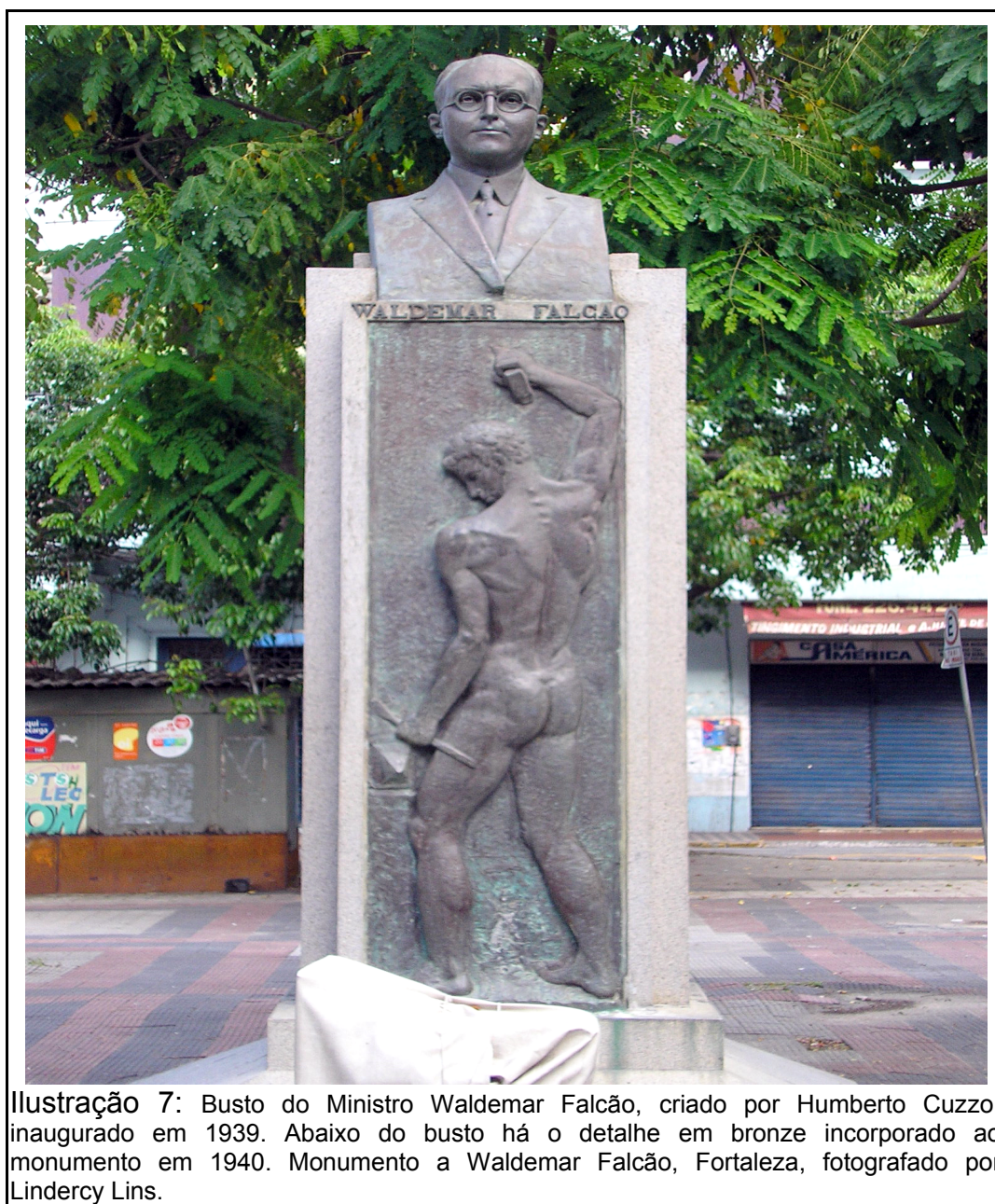
Ilustração 7: Busto do Ministro Waldemar Falcão, criado por Humberto Cuzzo, inaugurado em 1939. Abaixo do busto há o detalhe em bronze incorporado ao monumento em 1940. Monumento a Waldemar Falcão, Fortaleza, fotografado por Lindercy Lins.

vários discursos, entre os quais, o do próprio Waldemar Falcão, promovido pelo Departamento Nacional de Propaganda (DNP), futuro Departamento de Imprensa e Propaganda (DIP), a cerimônia inaugural do busto se encerrou com o Hino Nacional. No ano seguinte, foi inaugurado destaque ao busto do Ministro, no Jardim “Dr. Waldemar Falcão”, conforme noticiou O Unitário : o desfile das “classes conservadoras” culminaria na inauguração de um “artístico bronze representando o trabalhador 301 ”, conforme vê-se na fotografia atual do busto.