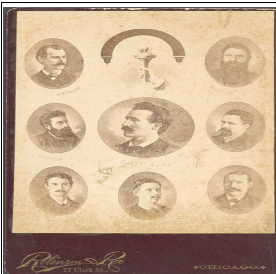
Ilustração 2: Foto de Robinson e Roe, 1887. impressão fotográfica: col.; 6 1/2 x 4 1/2 in. CHS Accession no. 1988.83 (CHS ICHi 31334) disponível na Sociedade Histórica de Chicago, digitalizada para o acervo digital Haymarket Affair Digital Collection. The Chicago Historical Society.

aos Mártires de Chicago (Columbia University Library). Interessante perceber a imagem feminina como alegorias da liberdade.