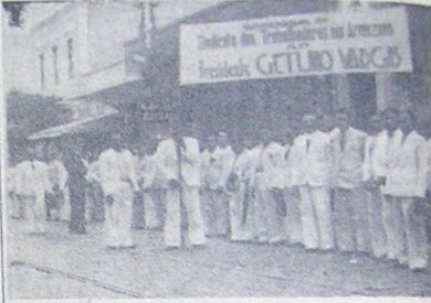
As representações dos diversos sindicatos concluíam grandes cartazes com dizeres exaltando a obra do presidente Vargas.