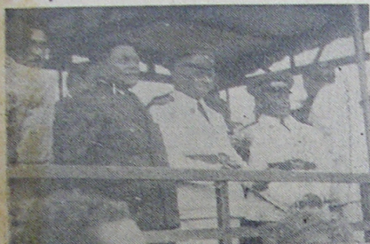
Do palanque oficial, na Praça dos Voluntários, as altas autoridades civis e militares, do Estado assistiram às imponentes solenidades do Dia do Trabalho.

Solenemente instalada a Justiça do Trabalho—Inaugurado o monumento do presidente Vargas na Praça dos Voluntários—As festividades de ontem