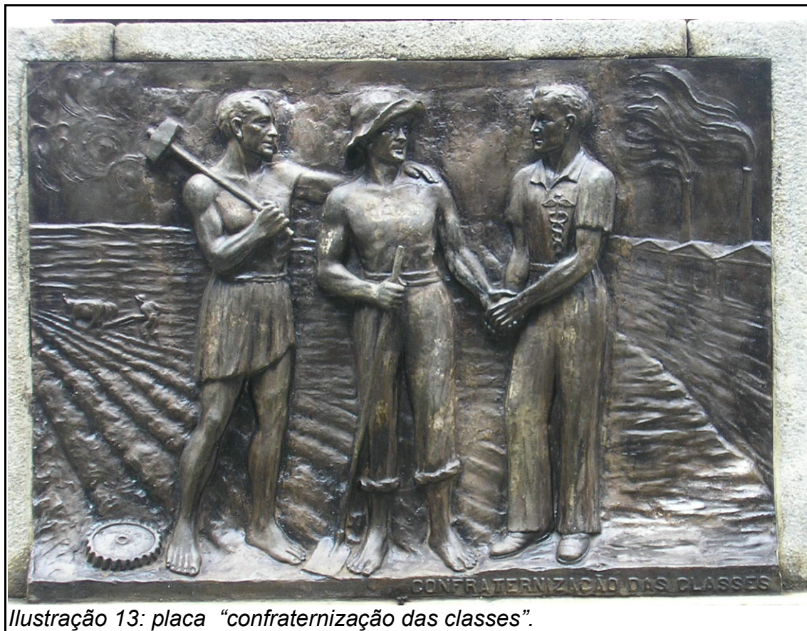
Ilustração 13: placa “confraternização das classes”.

Outro símbolo operário universal, o apertar de mãos, é a temática da placa ao Leste: “confraternização das classes”.