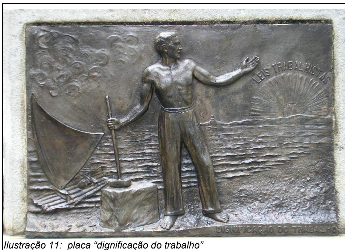
Ilustração 11: placa “dignificação do trabalho”

Observa-se o trabalhador saudando a aurora das leis trabalhistas 306 , que aparece como Sol nascente, evocando aspectos da natureza como o Mar e o Sol. Ao fundo, a praia, com o contorno do Mucuripe e da jangada, representando a pesca, tradicional atividade econômica cearense. É digno de registro o fato de que, em setembro do mesmo ano, o grupo de jangadeiros, liderados por Jacaré, fez viagem ao Rio de Janeiro em busca de audiência com o presidente Vargas a fim de reivindicarem direitos trabalhistas e denunciar as condições de trabalho dos jangadeiros. 307