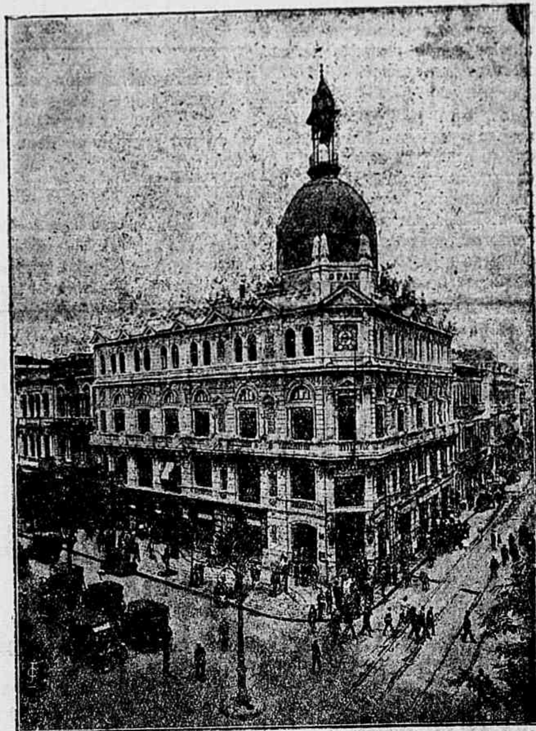
A redacção do antigo organ republicano na Av. Rio Branco

RIO, 3 (A. B.) — Foi requerida a fallencia do matutino "O Paiz". O titulo que instrue o processo é uma nota promissoria no valor de cincoenta contos de réis.