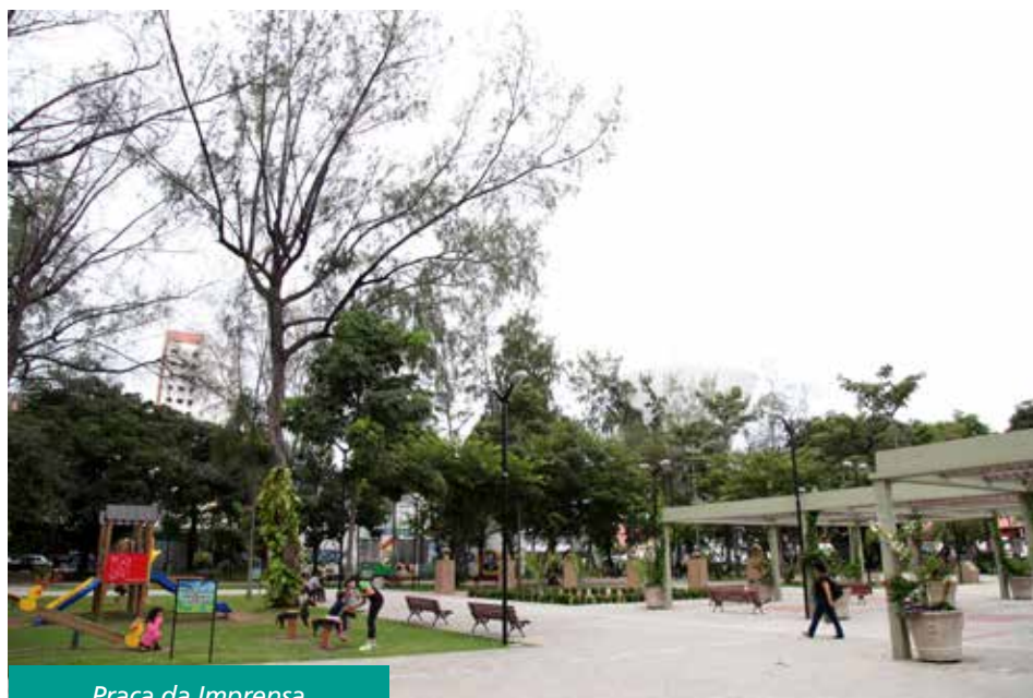
Praça da Imprensa