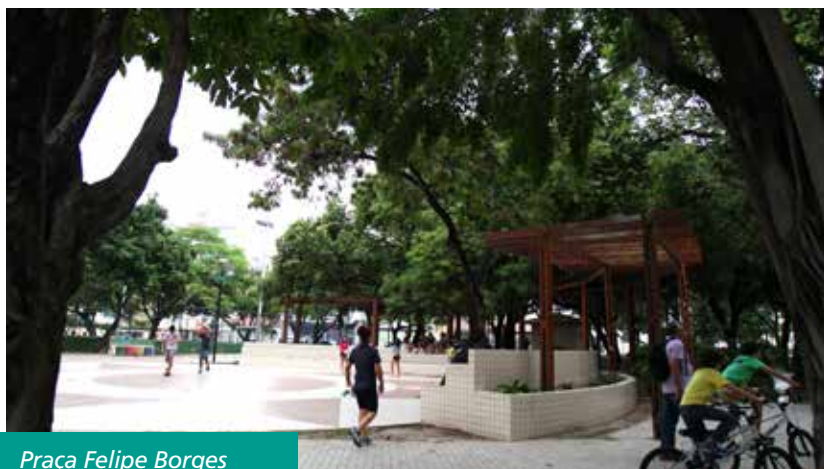
Praça Felipe Borges