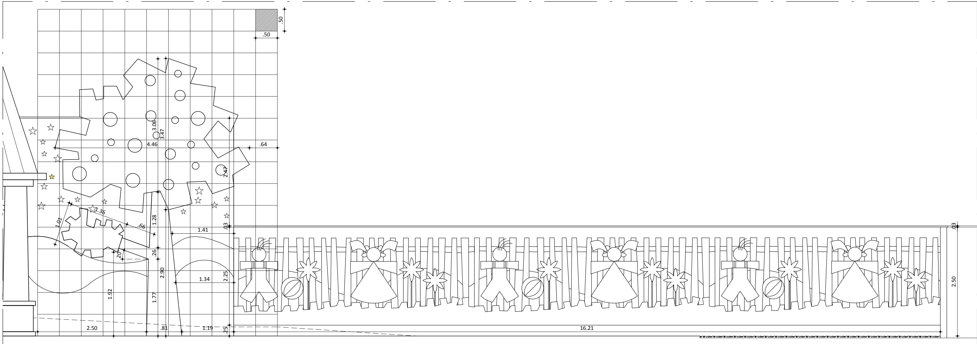
01 FACHADA PRINCIPAL-SETOR 02 esc.: 1/25

— IMAGICI / ASTECH ASSESSORIA TÉCNICA DE PROJETOS LTDA. — R. BARBOSA DE FREITAS, 1920, FORTALEZA — CE — TEL./FAX: 55-85-3261.2289 — IMAGIC-CE@IMAGICBRASIL.COM.BR