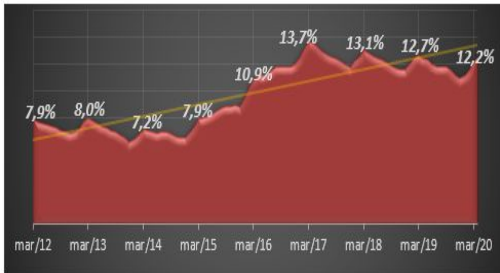
Gráfico 2 - Evolução da Taxa de Desocupação com relação à população econômica ativa (%).

Como reflexo dessa trajetória de baixo crescimento e recessão econômica, a taxa de desocupação da população economicamente ativa, em nível nacional, passou de 7,9%, em 2013, para 12,2%, em 2020 conforme apresentado no Gráfico 2 a seguir.