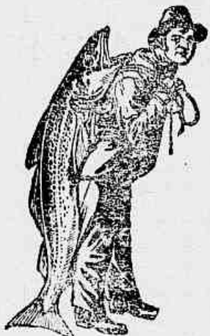
Marca da Emulsão Legitima.

necessitam a Emulsão de Scott que alem de um medicamento é um poderoso alimento concentrado, productivo de sangue, forças e boas côres.