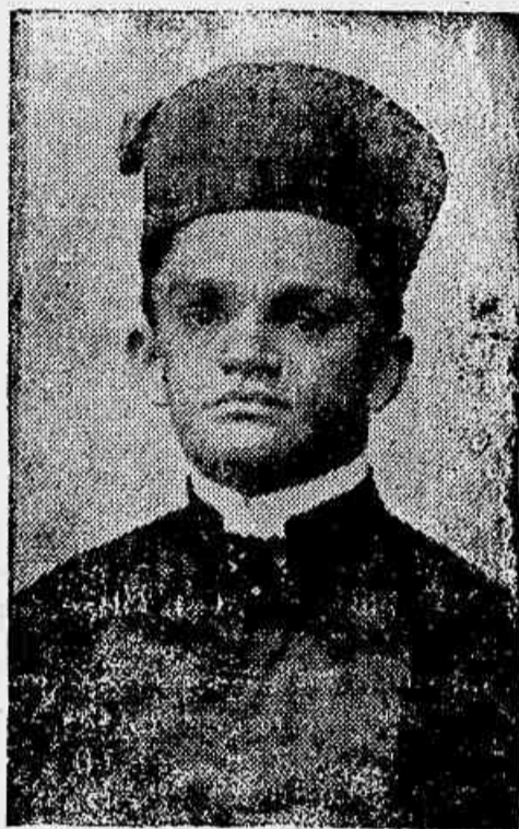
Dr. Moreira de Azevedo

Sob o n. 20 foi apresentado á Assembléa Legislativa do Estado, um projecto de lei autorizando o governo a conceder ao Banco de Credito Agricola de Sobral, os mesmos favores outorgados aos bancos de igual natureza de Camocim e outras cidades do Estado.