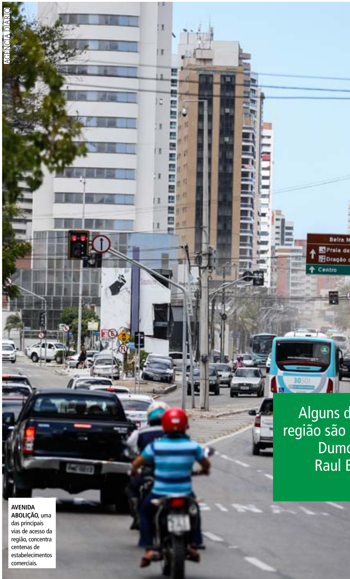
AVENIDA ABOLIÇÃO , uma das principais vias de acesso da região, concentra centenas de estabelecimentos comerciais.