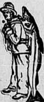
Nenhuma é legítima sem esta marca.