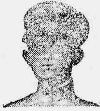
Srs. Viuva Silveira & Filhos

85 TESTEMUNHAS CONFIRMAM A MARAVILHOSA CURA