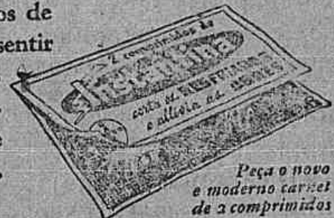
Peça o novo e moderno cartet de 2 comprimidos

Es o modo de combater um resfriado commum: Tome 2 comprimidos de Instantina assim que sentir os primeiros symptomas e, se necessario, repita a dose 2 ou 3 horas depois.