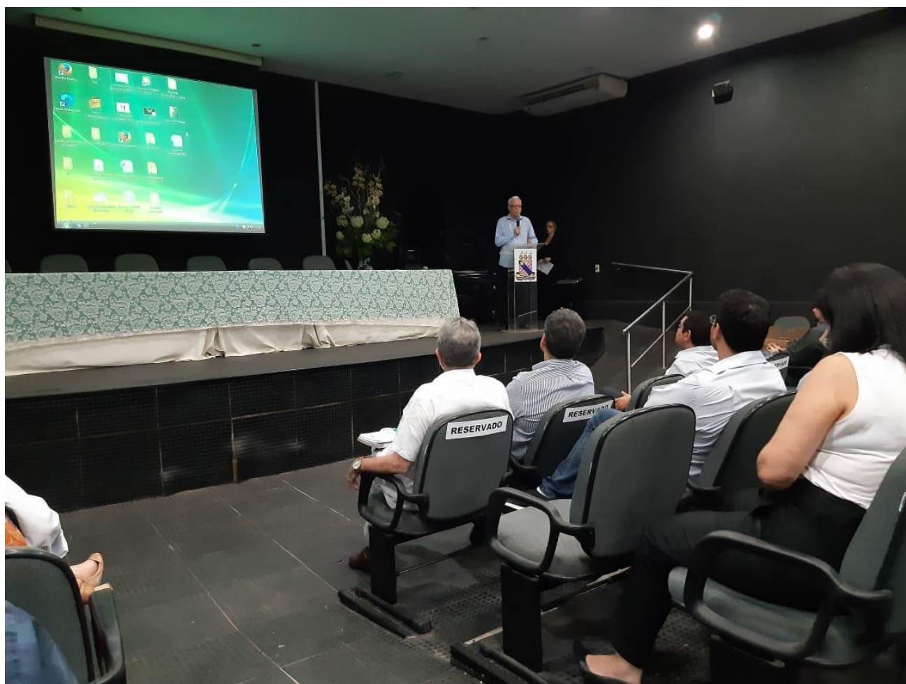
Foto 1 – Reunião de apresentação do projeto na sede da Reitoria da UECE.