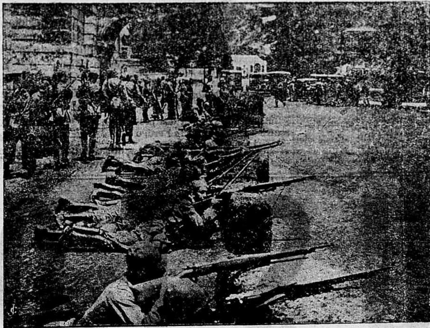
Defendendo a dignidade nacional que os politiqueiros continuam a enxovalhar

ordens severas, haver um pelotão de cavallaria da Policia percorrido até pela madrugada os diversos pontos da cidade.