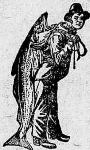
Marca da Emulsão Legitima.

necessitam a Emulsão de Scott que alem de um medicamento é um poderoso alimento concentrado, productivo de sangue, forças e boas côres.