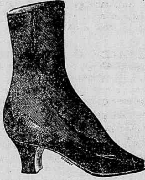
Calçados em todo genero

Calçados para homens: Botinas a pontos ou ponteadas 6$000 7$ 8$, ditos de pellica 8$ 9$ 10$, borzequins de bizerro 10$, Borzequins de pellica 12$ 16$ 18$, Botinas de Verniz de primeira 10$ 13$ 15, borzequins de Verniz 13$ 17$ 18$, Calçado Americano, de pellica preta ou amarella, 18$ 20$ 22$ Sapatos de pellica ou verniz de entrada baixa 12$, Botas de montaria de couro da rus-sia de primeira a 30$ 35$ 38$.