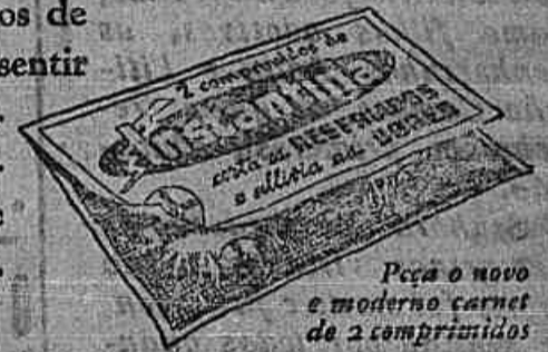
Peça o novo e moderno carnet de 2 comprimidos

Éis o modo de combater um resfriado commum: Tome 2 comprimidos de Instantina assim que sentir os primeiros sintomas e, se necessario, repita a dose 2 ou 3 horas depois.