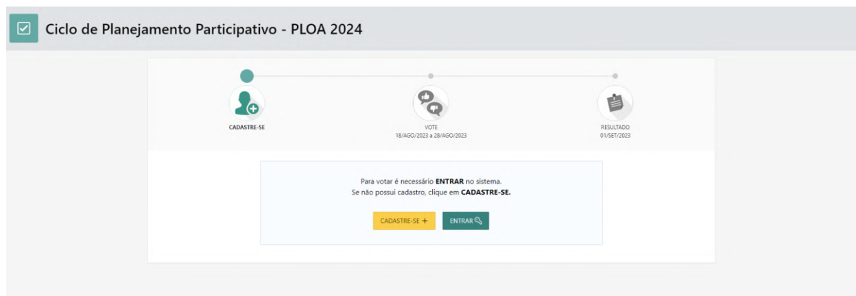
Figura 3 – Página online do Sistema Fortaleza Participa