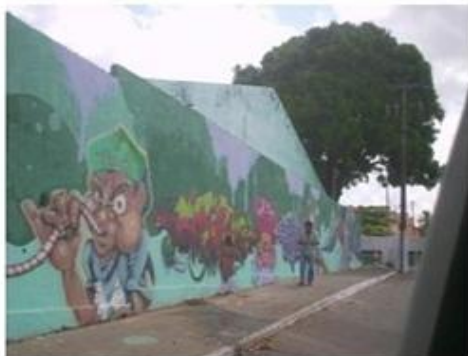
Dentro da kombi, saindo para a visita domiciliar. Fachada do Centro de Cidadania Gov. César Cals. (Diário de campo: 03/12/2009).

respondeu: “ Trabalhando! ” e a outra irmã um pouco maiorzinha completou: “ Pedindo, ele trabalha pedindo. ”