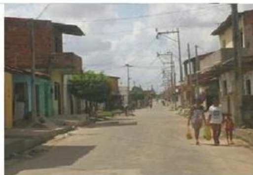
Ruas de Fortaleza, a caminho dos domicílios dos sócio-educandos.