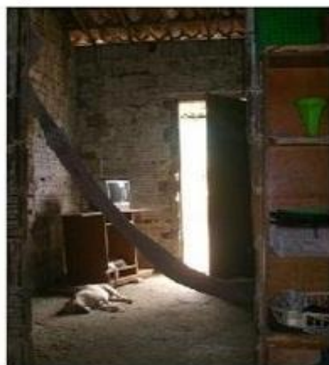
Foto da Sala da Casa de Rafael. Sua casa apersenta apenas dois cômodos. A foto foi tirada da perspectiva de quem está no segundo cômodo (quarto), olhando para a rua.