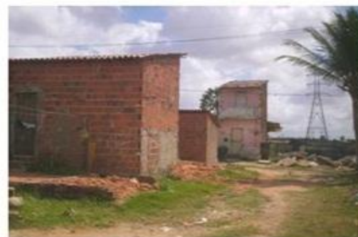
Aproximando da casa de Rafael.