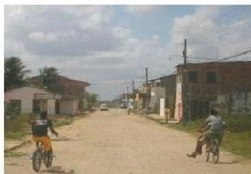
Adolescentes andando de bicicleta pelas ruas de Fortaleza, Na volta das visitas domiciliares.

O adolescente relatou que, recentemente, havia sido abordado pela polícia: “ Os ‘homi’ chegaram e perguntaram: ‘Tu puxa o quê?’ E eu disse que já puxei, mas num tenho mais nada não. E me deixaram na casa da minha tia. ”