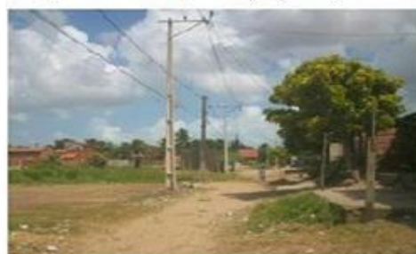
Aproximando da casa de Rafael.