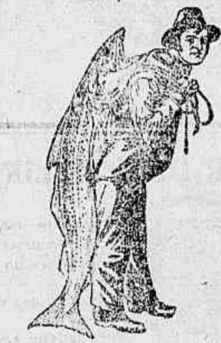
Marca da Emulsão Legítima

necessitam a Emulsão de Scott que alem de um medicamento é um poderoso alimento concentrado, productivo de sangue, forças e boas côres.