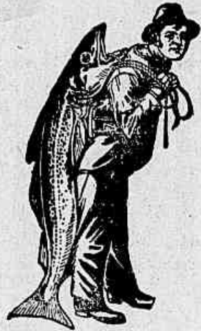
Marca da Emulsão Legítima.

necessitam a Emulsão de Scott que além de um medicamento é um poderoso alimento