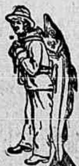
Nenhuma é legítima sem esta marca.